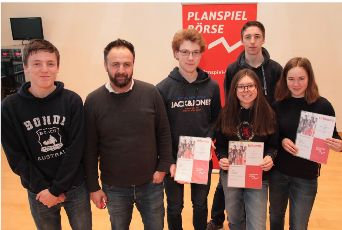
Die erfolgreichen Broker der Graf-Engelbert-Schule.